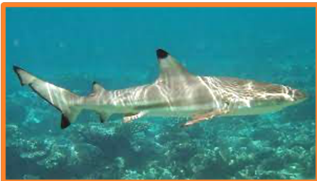
Le requin à pointe noire