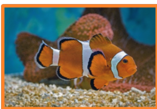
Le poisson clown

Découverte des aquariums où les coraux permettent aux divers poissons tropicaux multicolores de s'abriter (poisson clown, poisson chirurgien, barbu rouge...).