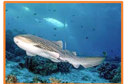
Le requin léopard ou zèbre