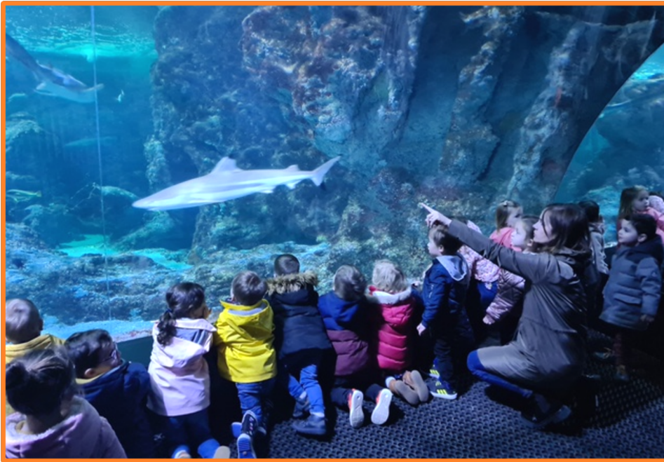
Les enfants observent les requins, les raies et l'impressionnant Napoléon...