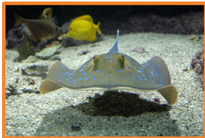
La raie à points bleues