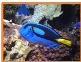
Le chirurgien bleu