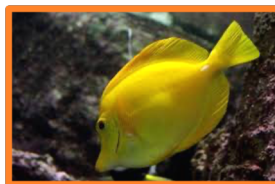
Le chirurgien jaune