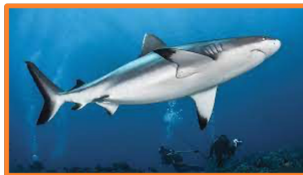
Le requin gris des récifs